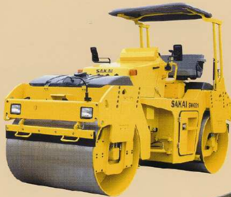
SW651 Rodillo en Tandem Peso Neto 7.1 ton (15.650 lb.)

Altamente efectivo para compactación de sub-bases y mezclas de asfalto en proyectos de construcción de mediana y gran escala