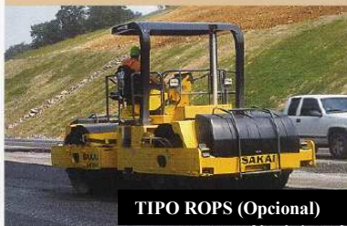
TIPO ROPS (Opcional)